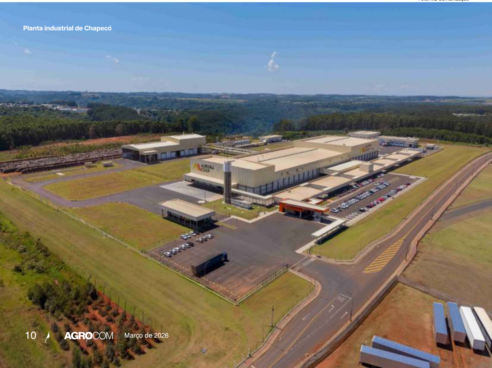
Planta industrial de Chapecó